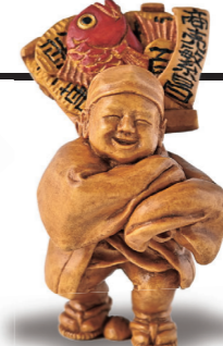
穴戸 濤雲 (1960～) 「西の市」 高4.3cm 黄楊

源氏物語の中でも佳人薄命で印象に残る夕顔。源氏と出会いとなった夕顔の花を蒔絵と象牙彫刻で再現している。