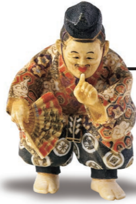
岸 一舟 (1917～) 「福の神」 高5.2cm 象牙

年初は八百万の神々を勧請し、新年を寿ぎます。古来より神霊には荒魂（あらみたま）と和魂（にぎみたま）の表裏の働きがあり、やがて幸魂（さちみたま）と奇魂（くしみたま）を加えた一霊四魂（いちれいしこん）による多面的な働きで物事を成就させるとされました。日本では古事記に登場する神をはじめ、天を仰げばお天道様、自然を眺めれば山の神や田の神たち、人為に尋ねれば門や柱、台所、古道具にまでも、あらゆる処に八百万の神がおはしまし、人々の営みと同居してきました。霊験あらたかな根付の神様をお迎えし、諸願成就を祈念します。