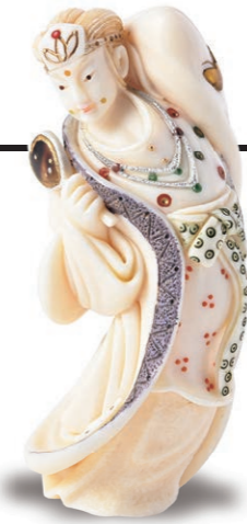
平賀 胤壽 (1947～) 「紗垂曼」 高6.2cm 象牙・べっ甲・貝

天岩戸伝説には鬼界カルデラ大噴火を示唆する仮説もあるが、ダイナミックなスケール感を感じさせる作品。