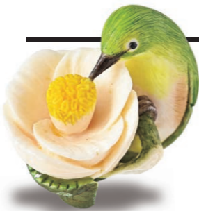
庄司 明幹 (1936～) 「メジロの好物」 高3.9cm 象牙

日本人は季節ごとの行事や習慣、風物を大切にしてきました。とくに季節の到来や節目に寄り添い、旬をはしり、さかり、なごりと分けるなど、その季節を楽しむ繊細な美意識によって季節感を大事にしてきました。根付においてもその旬を題材に採り入れ、また季節の特徴を切り取った様子はまるで歳時記のようです。季節ごとの情趣を楽しむ風流と季節の到来を尊ぶ行事には祖先を敬い、自然に対して感謝する「おかげさま」の心が息づいています。根付にも受け継がれてきた日本人の心を浮かび上がらせつつ、春夏秋冬の風物詩を巡ります。