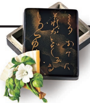
黒岩 明 (1949～) 「夕顔」 高4.4cm 黄楊・漆・象牙・ダイヤ・銀

蒸し暑い京の夏を風流に遊ぶ納涼床。川面の吹く風が心地よく、芸者と旦那の酌み交わす酒が進みそう。