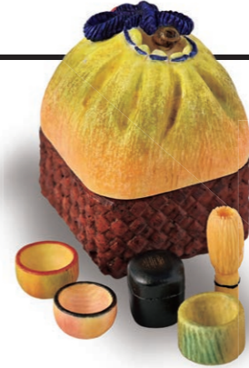
落合 尚 (1972～) 「庭宴」 高4.2cm 象牙・鯨骨

東洋思想の根幹をなす陰陽五行では野菜も五色に分けられた。菴に盛られた五種類の夏野菜の瑞々しさ。